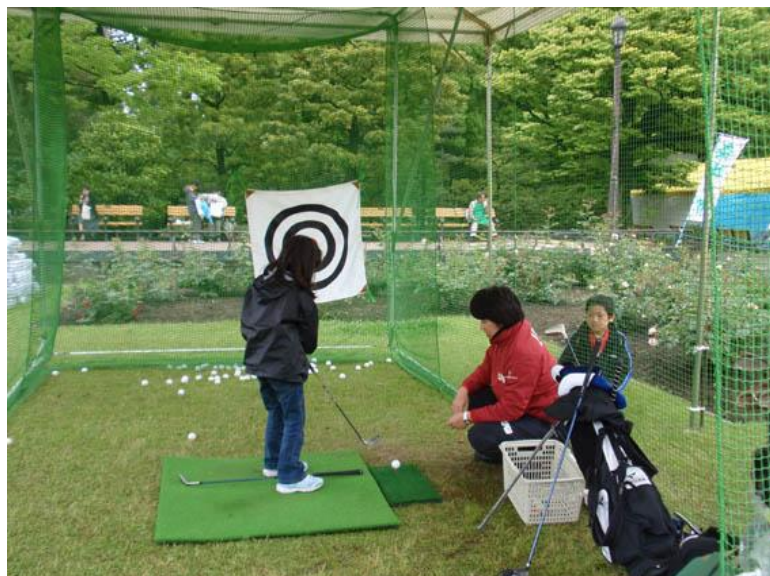
みどりの感謝祭でのチャリティレッスン

この教室に参加した子供たちは、ゴルフを通じて、ゴルフ場に自然がいっぱいあること、木や芝生だけでなくゴルフ場には昆虫も生息していることを体験しています。体験教室は、そうした自然に触れる良い機会だと思っています。